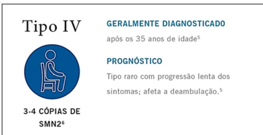
Figura 5: Principais características do paciente com AME tipo 4.

respiratórias, mas podem apresentar hipotonia e reflexos musculares diminuídos, apresentando dificuldades, por exemplo, para subir e descer escadas ou para se levantar do chão. No entanto, levam a vida muito semelhante à população sem a doença (ARAÚJO et al. , 2019).