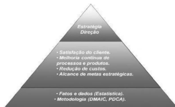
Figura 3: ESTRATÉGIA DO SIX SIGMA

O modelo piramidal, como demonstrado na Figura 3, destaca que, embora seja baseado em dados numéricos e estatísticos, o apoio da alta direção é fundamental para alcançar os resultados desejados (Nicoletti Júnior, 2007).