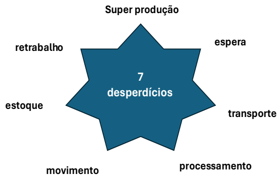
Figura 1: SETE DESPERDÍCIOS