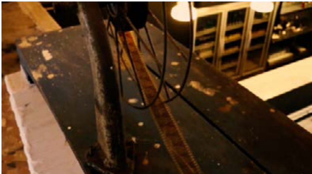
Figura 1 - frame do documentário Cinebar

por meio de softwares que contavam com a ajuda de IAs para a correção. Depois desses processos, o documentário estava pronto para uma primeira apresentação aos professores.